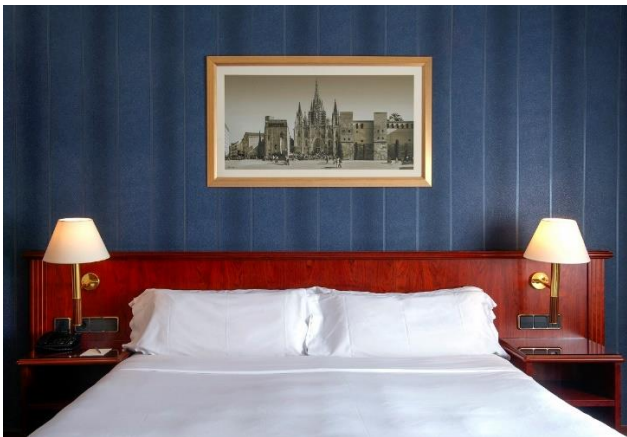
Standard dobbel rom

Rommene har satelitt-tv, safe (mot tillegg), hårføner, telefon, kaffe/te, bad med dusj eller badekar og wc. Handicaprom er tilgjengelig.